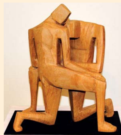
„Paar“ – Skulptur aus Eschenholz von Wolfgang Drabe