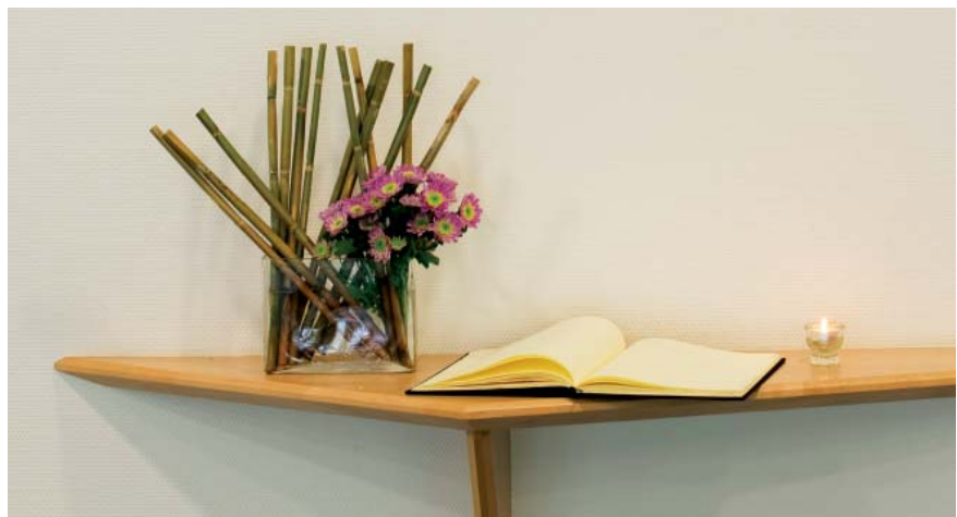
Eingangsbereich des Johannes-Hospizes mit Abschiedsbuch und Teelicht

Ich glaube, jeder der gut eintausend Menschen, die ich in München in ihren letzten Tagen oder Wochen behandelt